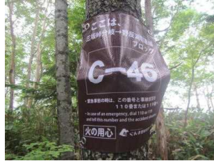
[位置ナンバー設置状況]